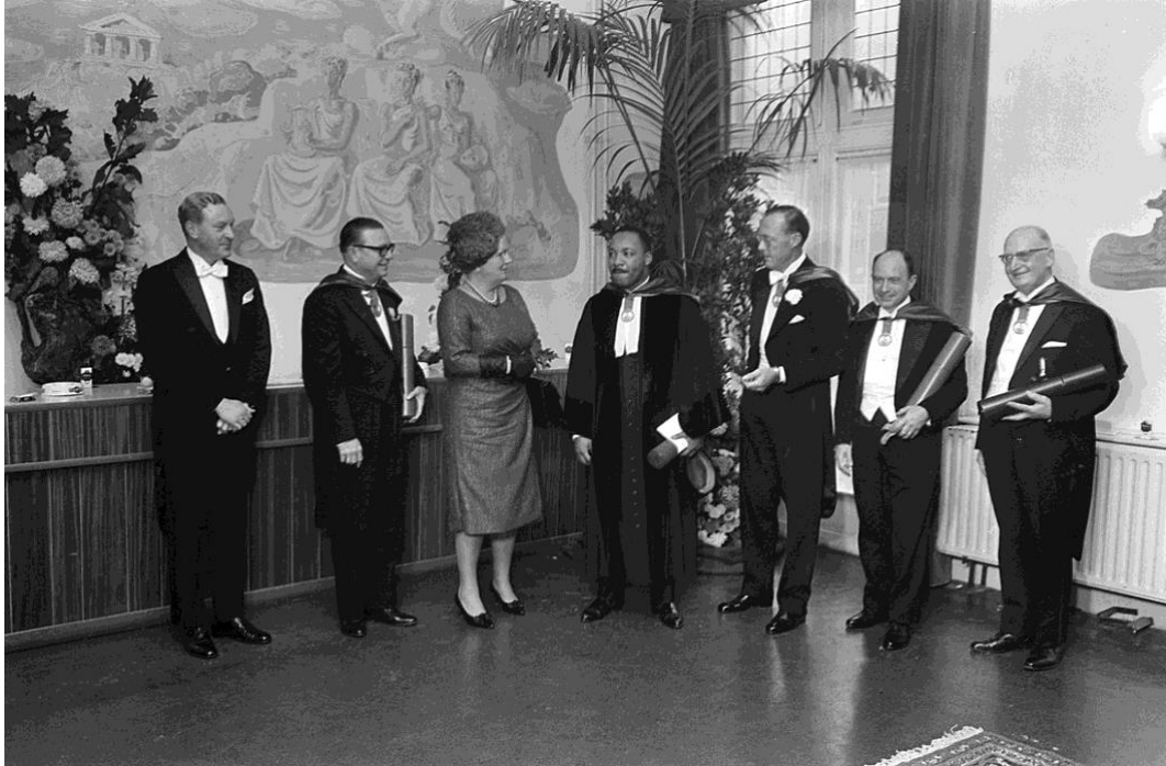
Jacques Ellul, tweede van rechts op de foto, ontving samen met o.a. Martin Luther King jr en ZKH prins Bernard een eredocoraat van de VU in 1965. 1